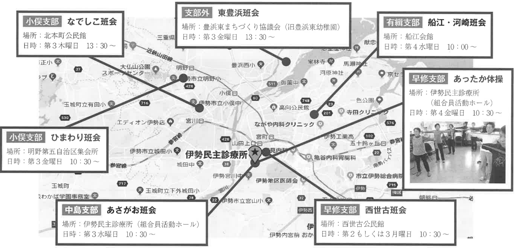
地図データ © 2018 Google, ZENRIN

「痛み止めの薬をもらうだけで、改善する方法を病院は教えてくれやんのやなあ。」と、とある病院を受診された組合員さんの一言。そういうときこそ私達医療福祉生協は、なんとかしたいと思います。その一つが班会です。体操班会では呼吸法に始まり、ゴムで出来たセラバンドを使います。認知症予防の体操をするときは、出来なくてもみんなで笑い合いながら楽しく。ときには看護師など専門職からの指導もあるのは、医療福祉生協ならではでないでしょうか。「みんなで楽しく」が基本で、班会は3人集まれば新しく作ることもできます。今回は体操班会をまとめてみました。お友達を誘って参加もよし、近くでなければ作るもよし。今年もみんなで健康づくりの輪を広げていきたいと思います。載っていない地域は次号掲載予定です。