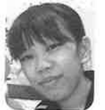
河北 千晴 (宮川さくら苑) こもれび

今年も、職員2名が組合員さんと職員のカンパのご協力を得て世界大会へ伊勢の代表として行かせてもらいます。暑い中カンパにまわっていただいた組合員さん、折り鶴を折っていただいた利用者さん、折り鶴に糸を通してくださった組合員さん、みなさん、ありがとうございました。みなさん、行ってきまーす!!