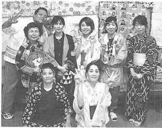
※季節を感じて頂けるよう、スタッフが浴衣を着ました! カラーでお見せできないのが残念です。

ある利用者様からは「私は孫もいないから祭りも行ったことがない。綿あめも食べたことないし、作ったこともない」とお話を伺い、実際に作って召し上がって頂いた時の笑顔は忘れられないくらい素敵なお話でした。その他の利用者様もとても喜ばれ昔を思い出さ