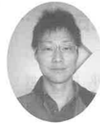
宮川さくら苑デイサービス 作業療法士