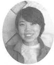
宮川さくら苑デイサービス