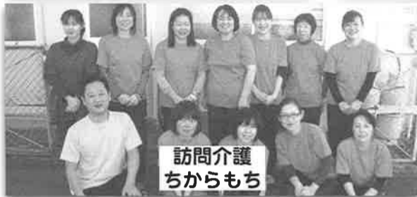
訪問介護 ちかもち