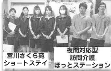
宮川さくら苑 ショートステイ 夜間対応型 訪問介護 ほっとステーション