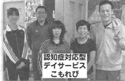
認知症対応型 デイサービス こもれび