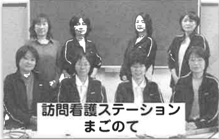
訪問看護ステーション まごのて