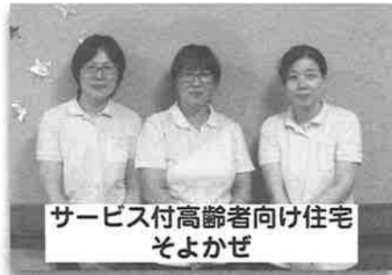
サービス付高齢者向け住宅 そよかぜ