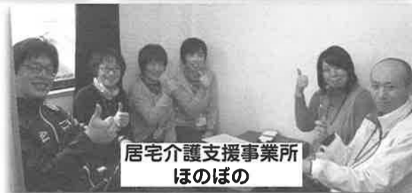
居宅介護支援事業所 ほのほの