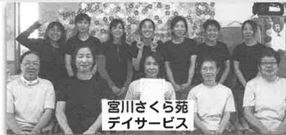
宮川さくら苑 デイサービス