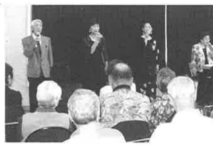
小俣支部コンサート

2015年度 中島支部総会開催 5月18日中島支部総会が診療所二階で開かれました。 まず支部長の挨拶から始まり、例年通り活動報告と会計報告が承認され、その後で新年度の役員と支部運営委員の選出が行われました。結果は昨年と変わりなしという事になりました。活動計画は、概ね昨年と変わりありませんが、今年度の大きな取り組みは①今年4月から始めた「カフェゆうづる」の輪を広げたい！毎月第二火曜日午後2時から民診の待合室で開いています。②街角マップ作りに取り組みたい。③今